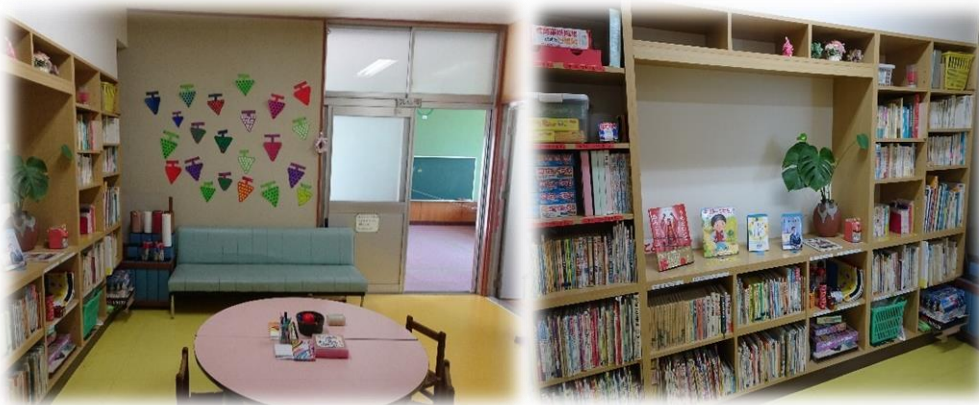
おすすめの本コーナー

待合室の様子です。保護者や子ども向けの本がたくさんあり、貸し出しも可能です。毎月の「おすすめの本コーナー」を設定し、保護者の方にも楽しんでもらえるようにしています。